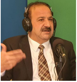
عبد الرحمن طراد شاعر لبناني

جفاء حبيب يا منية الهوى ملئت جفاك كيف الوضول وبعبك جفاك رخلت للثوى وبعبك مؤلم فلكم شكا المؤاد ضيم نواك ولكم رجا بالذمعي مني فزرك ويذ الزمان تجيل يوم لفاك غضضت طريقي يا أميرة شوقا ما نام طريقي في الدجى وخلاك رجمك خني من جفاك فإني مخيم قلبي أسير هواك يا من ملكك النفس أنت هواها زوجي قلبي والحياة فذاك ذبلت وزدة الدبار ذأوها إن السقيم تعافيه يذاك واسترسلت وزقات فكاأها سكّمت مياة الغيث ترجو فتاك سقيتها بالرأخيتين تراغشت أغصانها طمأنة لنداك وهوت على طلل تودع رنمه فالريح تلغو بها عند طلاك هذي عروسة الرئي رخلت وسيد طر الهسيم على خضب زياك وودعت خضاشة لوداعك فالقلب أي الطاعنين يباكي ماتت وزيدة الدبار غريبة فناح طير فوقها وكباك بالأمس كم وعت على خطواتنا وخضات ورفاأنا صمناك وكم تبادلنا الحنان بقينها وعانقت سني كم شفتاك