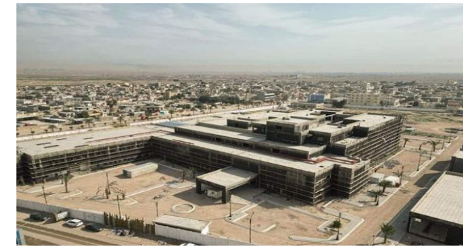
البصرة بسبب تلكؤ الشركة المنفذة في الإنجاز وفق التوقيعات الزمنية المحددة . مبنية، إن المشروع عبارة عن مجمع صحي متكامل الخدمات، نفذ وفق

حدث التصميم على أرض مساحتها (٣٧) دوماً، وبسعة (٢٠٠) سرير، وأربعة طوابق، إضافة إلى بنايتين لسكن الأطباء وبناءة الخدمات والمشرحة ومحطة المعالجة الحياتية ومهبط للطائرات مع بقية الأبنية الخاصة بالمستشفى . وأوضح البيان : إن كلفة المشروع تبلغ قرابة (٧٠) مليار دينار ، في حين بلغت نسبة الإنجاز أكثر من ٧٦.٣ % ، وفي حال إيجازه سيشهد تقديم الخدمات الطبية والصحية والاستشارية لأهالي مناطق ( الزبير ، خور الزبير ، سفوان الشعبية ، البرجسية ، الرميلة والدواجن) في محافظة البصرة .