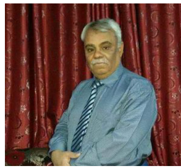
متابعة: احمد المرواني

ففي واحدة من مباريات الدوري الإسباني والتي وصفنا بأنها من المباريات الأكثر إثارة نادي جيرونا يفاجأ ريال مدريد العنيد بالفوز عليه برعاية نظيفة مقابل هدفين ليقبل من حظوظه في التنافس على