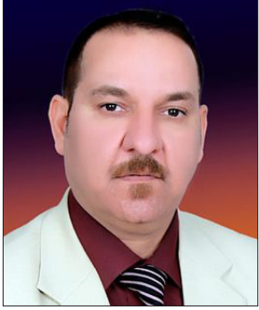
بقلم / احمد الديلمي

غالبا ما يوصف الزعيم الذي يتلذذ بالشجاعة في صنع القرار الحكيم لقد وصف المؤلف الكاتب العراقي حسين العنكودي في الكتاب الجديد الذي يسلط الضوء على شخصية الرئيس نيجرفان بارزاني و رؤيته الوطنية في العراق وإقليم كردستان.. وكذلك رؤيته للمرأة والإقتصاد وتعامله مع المثقفين في عموم العراق والدبلوماسية المرنه التي يتلذذها رئيس الإقليم مع إشارة من الكاتب إلى تاريخ الكورد ومدينة أربيل والزعيم مصطفى البارزاني والسيد مسعود بارزاني..