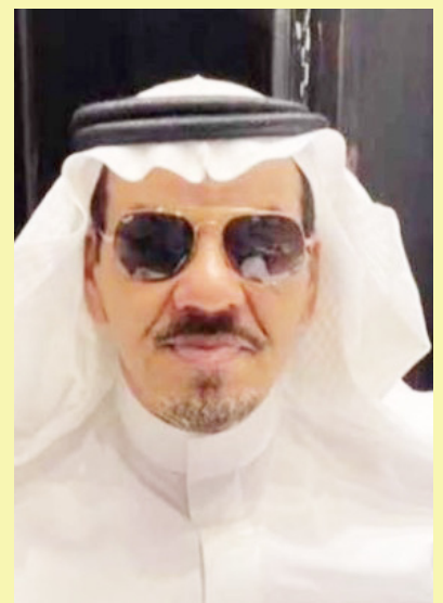
الشرق - القاهرة - متابعة وكتابة / احمد بدر نصار

تنطلق فعاليات أكبر مؤتمر ومعرض للسياحة العربية والإسلامية، والحج والعمرة في ماليزيا خلال الفترة ١٣-١٥ سبتمبر المقبل، بمشاركة ٥٧ دولة عربية وإسلامية، ليكون أكبر تجمع لتسويق خدمات الحج والعمرة في قارة آسيا، التي يوجد بها ما يزيد عن ٧٠٠ مليون مسلم، لاسيما أنها القارة التي تساهم ما يزيد عن ثلث مبيعات الحج والعمرة بما يقدر بنحو ١٢ مليار ريال سنوياً، وهو ما يؤكد على أنه سوق كبير يمكن الاستفادة منه للترويج للسياحة الإسلامية، والعمل على دعم السياحة في أمنا العربية والإسلامية.