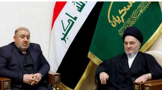
بهذه المناسبة (وأضاف (إن اللقاء تطرق إلى الخدمات التي تقدم إلى زائري الحرام والنشاطات التي أقامتها العتبة العسكرية المقدسة لآيام شهر محرم الحرام

بغداد / عمار العبودي استقبل أمين عام العتبة العسكرية المقدسة الأستاذ الدكتور محمد قاسم أستاذ الحوزة العلمية الشريفة سماحة السيد جعفر الحكيم (دامت توفيقاته) (بكتبة الخاص في العتبة العسكرية المقدسة. وقال الأستاذ خليل إبراهيم مسؤول إعلام العتبة العسكرية المقدسة (إن السيد أمين عام العتبة العسكرية المقدسة استقبل سماحة السيد جعفر الحكيم (دامت توفيقاته) واستعرض اللقاء الكثير من القضايا ومن أهمها استعداد العتبة