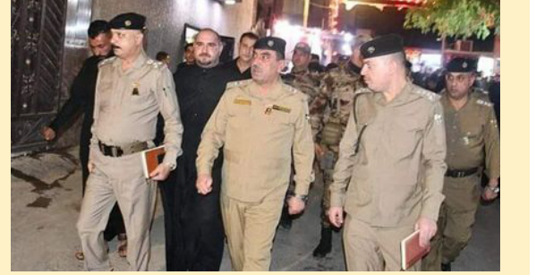
ضمن الجولات الميدانية لمتابعة آلية تنفيذ الواجبات وتطبيق الخطة الأمنية الخاصة بشهر محرم الحرام أجرى قائد شرطة ديالى اللواء علاء غريب الزبيدي جولة ليلية على المواكب ومجالس العزاء الحسينية في ناحية جديدة الشط، وشدد الزبيدي على مضاعفة الجهود المشتركة للأجهزة الأمنية وهيئة المواكب الحسينية والمواطنين من أجل إحياء الشعائر الدينية الخاصة باستشهاد الإمام الحسين (عليه السلام).

قائد شرطة ديالى يتابع ميدانياً تأمين الحماية الأمنية للمواكب ومجالس العزاء الحسينية في ناحية جديدة الشط