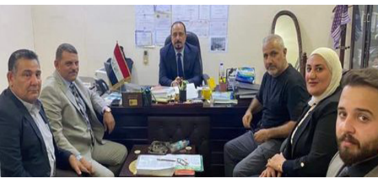
تنظيم عمل مركبات النقل الخاص موضحاً، بحثنا موضوع العداد الذي ورد ضمن القانون واللائحة التنفيذية لتنظيم وجود عدادات تعرفه في المركبات

العمومية لاحتساب قيمة تعرفه الأجرة بين السائق والمواطن، وأشار إلى أن العداد سيكون لتنظيم عمل المركبات في داخل وخارج المحافظات، فضلاً عن الحد من الخلافات والظواهر السلبية مضيئاً ناقشنا تعديل مسودة القانون، وسيعقبه اجتماعات أخرى لإصدار تعليمات بهذا الخصوص والإعلان عنها بشكل رسمي خدمة للمواطنين الكرام مضيئاً، أن السياقات والإجراءات التي يتم تنفيذها من أجل تطوير قطاع النقل الخاص والتي تساهم بدفع عجلة التطور.