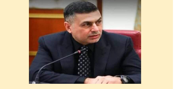
وجه محافظ البصرة أسعد العبداني مدراء شعب البلدية بترك المكاتب والنزول إلى الشارع لمتابعة كوادرمهم ورفع النفايات بصورة صحيحة من مختلف مناطق المحافظة، بعد انتهاء عزاء يوم العاشر من المحرم الحرام.

محافظ البصرة يوجه مدراء شعب البلدية بالنزول إلى الشارع لمتابعة رفع النفايات