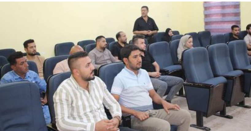
الشرق / كواكب علي السراي