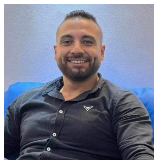
القاهرة: احمد بدر نصار

أرض مدينة العفرقة بعد بثابة جمحة ثقافية وفنية تضيئ سماء الفنون المصرية . ويذكر أن الفنان والمخرج محمد عبدالقادر شارك في العديد من الأعمال الفنية كتمثيل في مسلسلات خيالة عهد وجيلة ، والان أصبح أحد رواد صناعة المحتوى وتقديم المواهب الفنية العربية . وقررت إدارة مهرجان العفرقة لسينما الشباب في نسخته الافتتاحية والأولى تكريم النجم هاني سلامة ، بدرج المهرجان تقديراً لمساهمته في إثراء السينمائي المتنوع والمتميز . ويشهد حفل الافتتاح الذي يقام يوم ٢١ سبتمبر المقبل حضور قيادات وزارات الثقافة والسياحة والآثار والشباب والرياضة وحفظة البحر الأحمر ولغيف من النجوم والتقاد .