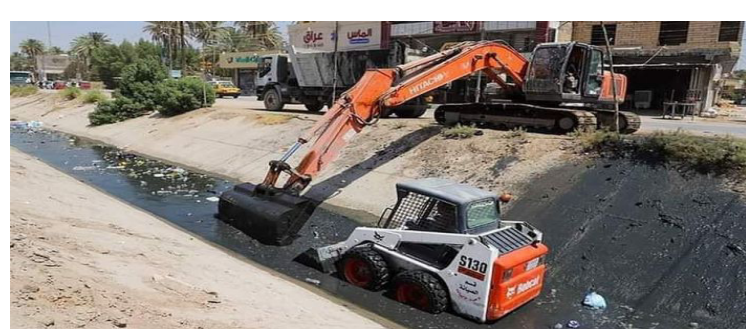
بغداد / عمار العبودي

العليا ، والمتولي الشرعي للعتبة الحسينية المقدسة الشيخ عبد المهدي الكربلائي باشرت الكوادر الفنية والهندسية في قسم الصيانة وذلك بالتعاون والتنسيق مع مديرية الموارد المائية في محافظة كربلاء المقدسة لتنظيف نهر الرشيدية في منطقة البوبيات بعد أن أغلق بالكامل بسبب الغيايات والمخلفات والانتفاض التي تراكمت فيه طيلة الفترة الماضية. وأوضح أن «أعمال الكري في النهر التي تقوم بها وحدة الآليات والمعدات الثقيلة التابعة لتقسماً انطلقت من بداية سيطرة