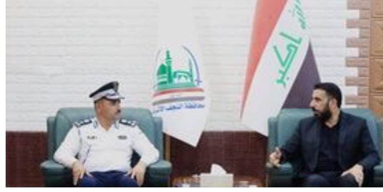
الرباط بين مسجد الكوفة المعظم ومسجد السهلة المعظم وكذلك الشوارع الرئيسية في جميع الاقضية والنواحي وبالأخص الشارع الرئيسي في الحيدرية وطريق الجدول فيما

الذي يسلكه الزائرين التنسيق مع البلدية برفع العوارض والمعوقات من مجسرات تورة العشرين إلى ساحة الفتح في مركز المدينة القديمة مع تنظيم قوفو أليات الجهات الساندة لتنسيق مع البلدية والأنواع والمركز المختص بتنظيم حركة السير في الشارع الواقع أسفل مرقد صافي صفا مع فتح الساحات القريبة منه جولة استطلاعية للمنطقة الواقعة خلف الساحة القريبة من عمود (٦٦٣) لغرض إمكانية فتح شارع بديل للحالات الطارئة والاختناقات المرورية بالتنسيق مع هيئة الأعمار وقيادة قوات الحدود بوضع ألية مرابطة نوع (كربن) قرب الاستدارات خصوصاً قرب عمود (١) وعمود (١٦) وذلك للحاجة الماسة له برفع وسحب اي عجلة عند عطلها أو توقفها تنادياً حصول