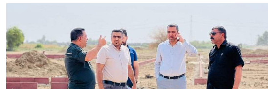
الشرق / كاظم حسين

وأماكن ترفيهية بخدمات متكاملة كورنيش جامعة واسط ، وتنفذ أيضاً مشروع تطوير منطقة حي الحوراء والوقوف على نسب الإنجاز فيه. وأكد الزركاني بأن الحكومات المحلية تسعى لإنشاء أماكن ترفيهية للعوائل وتطوير الحدائق والمتنزهات في المناطق التي أجرت فيها أعمال البنى التحتية وأعمال البلدية.