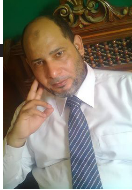
شعر : د احمد جاد

أن التقدير يعون منه خامينا إن كان شأنهم صون العدا فينا لن يلمسوا أبدا ضغنا ولا ليانا لا شيء يهيب أهل الحق ما صدقوا وقد عرفناه دون الخلق كافيها نشأتنا فخرا له الأيام ناظرة لكن شأنهم ذا الفجر يؤدينا والنصر فوق رؤوس الأسد منتظر آيات من صدقوا فخلا وتكوننا هادي القصيد لأجل القدس خالصة توثق الجهد ترتيبا وتدوينا بالصدق نراز في الأفاق معتتقا وينصر الحق إغلاء وتبينا داب الكريم إذا نادته أمته لبي النداء مدى الأفاق تأدينا فليصمت الشعر إن لم يحك ملحمة ما قيمة الشعر إن غلت قوافينا!؟