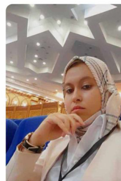
قسنطينة يا ملكة سيرتا ، التي أسالت حيز كل العشاق ، وكتبت التاريخ ،

أنت يا امرأة تحدث الزمن بين حضارة نوميدية وعمانية ، ومارالت تحيا إلى الآن كامرأة جبلية ، أنت يا حاضرة يا جزءا من وطني ، يا من ألقت على بسحرها دون أن أعرفها ، أنت يا من تركت ابنها نزيلا في قلبي لاحقا في روحي