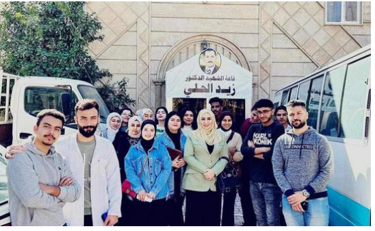
بغداد / عمار العبودي

أقامت كلية الطب في الجامعة المستنصرية، زيارة ميدانية للمركز العراقي لبحوث السرطان والوراثة الطبية، في إطار رفع الطلبة بالخبرات العلمية والعملية.