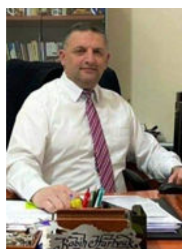
بقلم: د. ربيع حروق لبنان

دول مختلفة تحت مسميات مغلوبة ارتدت رداء الشرعية السمحة زوراً وبهتاناً، وعلى حكومات جمهوريات آسيا الوسطى التي تعتبر أشعاعاً حضارياً تاريخياً أن يكون ذلك على رأس أولوياتها، وهذا لا بد من الإشارة إلى عدة نقاط تأسيسية على مستوى المؤسسة الدينية في تلك الجمهوريات من شأنها أن تساهم في عملية الإصلاح والتعمير للفكر الوسطي المعتدل، أبرزها: