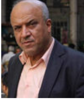
علي صحن عبد العزيز

كثيرة هي المواقف التي تتلقاها حينما يتوفى لديك شخص ما ، ولكننا هنا نشير في الآونة الأخيرة بروز ظاهرة التصوير في مراسم العزاء دون مراعاة لمشاعر أهل المتوفى، فهناك الكثير من المصورين في سرادق العزاء ، والأدعي من ذلك تجد تلك الصور وقد أنتشرت على منصات التواصل الاجتماعي والتك توك وبمئات المناسبات عريضة يستعرضون أنفسهم وملابسهم وسط إغراءات مللة ومقبتة لا يهمهم حال أسرة المتوفى ، ولكن كل ما يشغل باهم التقاط صورة (صورتي وأني ما أدري) لكي