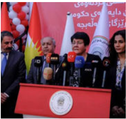
الشرق / عمار العبودي

افتتحت رابطة المصارف الخاصة العراقية بالتعاون مع مؤسسة بارزاني الخيرية مدرسة وروضة (حليجة) في محافظة حليجة بعد إعادة تأهيلها من قبل من صندوق المبادرات المجتمعية «تكنين» الممول من المصارف الخاصة.