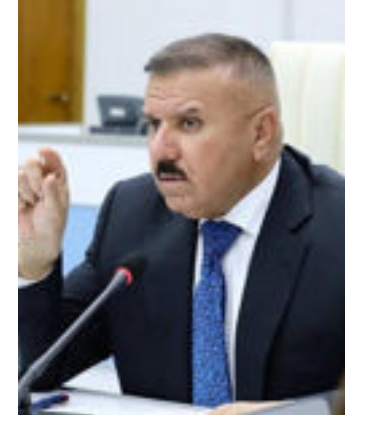
شدد وزير الداخلية عبد الامير الشمري، على وضع آليات حديثة ومتطورة للإعلام

الأمني وفق رؤية صحيحة. وذكر بيان مكتبه، ان «الشمري ترأس اجتماعاً ضم مدير دائرة العلاقات والإعلام والناطق الرسمي باسم وزارة الداخلية ومديري الإعلام في وكالات وقيادات ومديريات وأقسام العلاقات في جميع مفاصل وتشكيلات الوزارة».