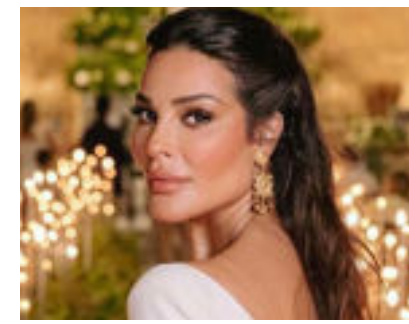
لم تعلق نادين نجيم على الفيديو المنتشر على المواقع البديلة وبطلته الممثلة السورية هبة نور. والمعروف ان نادين

ونور تربطها صداقة قوية، كما أن الشاب الذي ظهر في الفيديوهات يعتبر خليف نور بحسب ما بدأ يعلن عنه؛ والفيديو الذي هو أصل المشكلة، بات يسحب من المواقع البديلة بعد الازمة التي ظهرت فيها إلى جانب شاب وهما يقومان بحركات لها دلالات معنية، لتبدأ الحملات ضد نور والشاب المفترض أنه إلى جانبها، وكأنها حملة مبرجة.