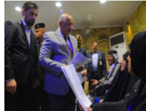
الشرق / حسن الطويل

التقى محافظ كربلاء المقدسة المهندس نصيف جاسم الخطابي بعدد من المواطنين على قاعة الإدارة المحلية بحضور مدراء الدوائر الخدمية في المحافظة ويستمع إليهم وينظر بطلباتهم ويوجه مدراء الدوائر حلها بشكل مباشر.