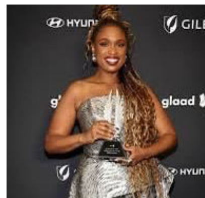
خلّت جينيفر هيدسون بصراحة كاملة بشأن اللحظة التي اكتشفت فيها وجود إخوتها وأخواتها الـ 26 خلال ظهورها

في حلقة من برنامج مطبخ ماما الخاص بك تذكرت نجمة فتيات الاحلام أنها علمت عن أطفال والدها الراحل صموئيل سيميسون العديدين عندما كان مراهقاً. وقالت: «هناك الكثير منا يبدو أن والدي كان لديه 27 طفلاً». وأضافت هيدسون (٤٢ عاماً): «هذا عدد كبير من الأطفال. لم أقابلهم جميعاً مطلقاً، ولكن هذا هو الأمر. أنا فرد من العائلة، ولذلك عندما بلغت السادسة عشرة من عمري، قلت، أريد أن أذهب للبحث عن والدي، وأريد أن أقابل جميع إخوتي وتابعت: «لقد كان حلمي أن ألتحق جميعاً على طاولة عيد الشكر أو عيد الميلاد