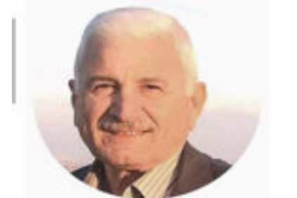
سرور ياور رمضان العراق

مترّف بالأوجاع قلبي تفتيحاً إنكسر الشوق يؤجج فتيل الأحران في فتيل الوجد ليعود الوجد يقبل خد الخنين خضراً، نظراً يرقد في حضان الأحلام رهواً هسيس يقضم فتق جرح يرتفع في خقل الأوجاع بلتفهم صرخات الصمت في أئين الصبر بلوك صغيخ البرد في مرارة الانتظار على مرفأ الانكسار و شواطئ الضجر عند باب الاستيقاق المكنتظ في خوابي الذاكرة زجيج الصدى وصباية الشوق موشوم بعقيق حزن بأبي الرحيل يغمغم بالوجع الدفين عينا تحاول وتنتسى تخفف دهشة الاصغاء هوى كان للقلب فنار وأكليل غار يا غربة الروح وحسرة تسكن صمتي ويتقمص ذاتي سهاد كشوك الصبار يديم قافية شعري بذكوتي بما لست ناسبه وأنا أتوكأ على قلبي العنيد أوأكب خطوات حنين يديم الحزن على مظال الصبر وصحب الضمت في مرارة الانتظار