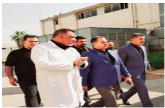
بغداد / عمار العبودي

تفقد السيد مدير عام الشركة العامة لصناعات النسيج والجلود موقع الدباغة في الزعفرانية أحد المواقع التابعة للشركة برقعة السيد مدير مصنع الجلود وكان في استقباله السيد مدير موقع الدباغة ومسؤولي الأقسام وتجول السيد المدير العام في المعامل التابعة للموقع والتي بسؤولي المعامل وأبدي من خلال تجواله في معامل الكبيرة والصغيرة لدبغ الجلود ومعالجتها جودة الجلود العراقية ومتانتها مؤكداً على ضرورة الاحتفاظ بغوية المنتج العراقي وتحديث المنتجات وفق المواصفات العالمية .